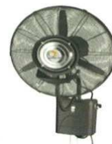
Serie MFB (Pared)