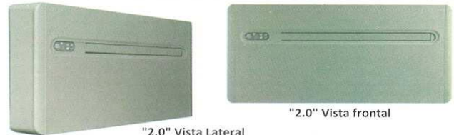
"2.0" Vista Lateral